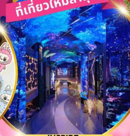
คาเฟ่ดัง Forest Outing