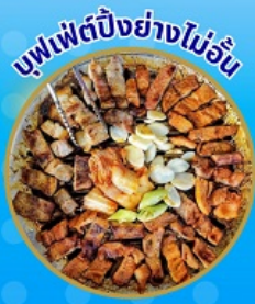
บุฟเฟ่ต์ปิ้งย่างไม่อื่น