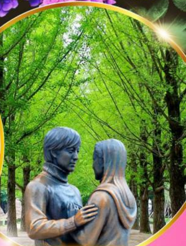
เกาะนามิ