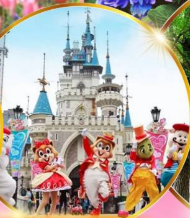
สวนสนุกลีอตเต้เวิร์ล