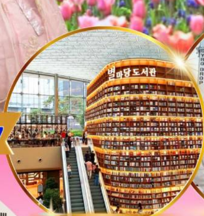
ห้องสมุดสตาร์ฟิลด์