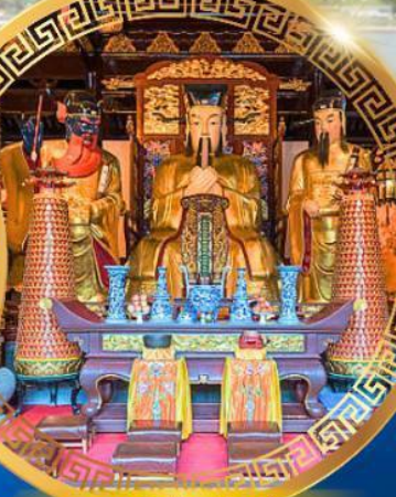
ศาลเจ้าพ่อหลักเมือง