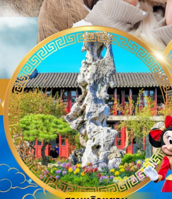
สวนหลิวหยวน