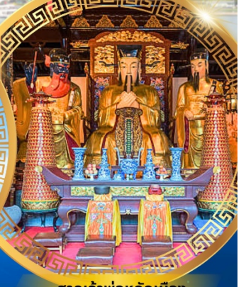
ศาลเจ้าพ่อหลักเมือง