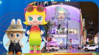
ช้อปปิ้ง POP MART

พักโรงแรม 4 ดาว ★★★★★ ฟรี ประกันอุบัติเหตุ บริการอาหารท้องถิ่น