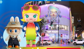
ช้อปปิ้ง POP MART