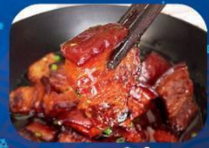
พิเศษ!! หมูสามชั้นน้ำแดง