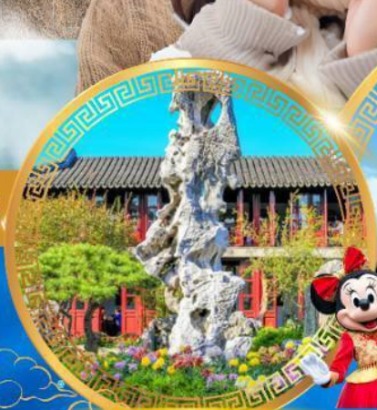
สวนหลิวหยวน