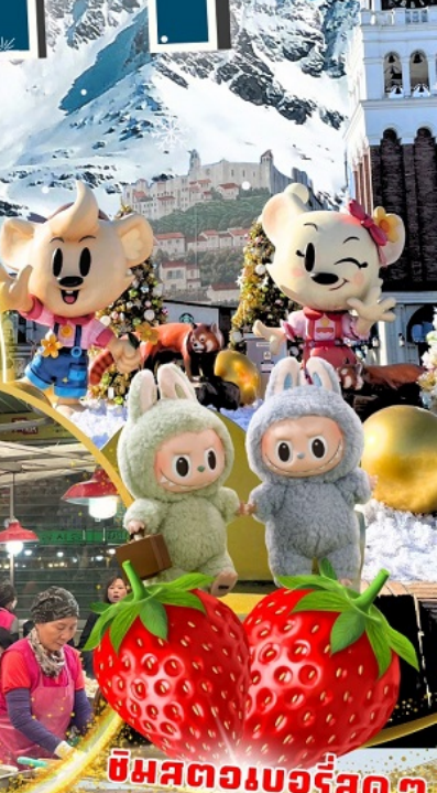
ตลาดกวางจ็อง