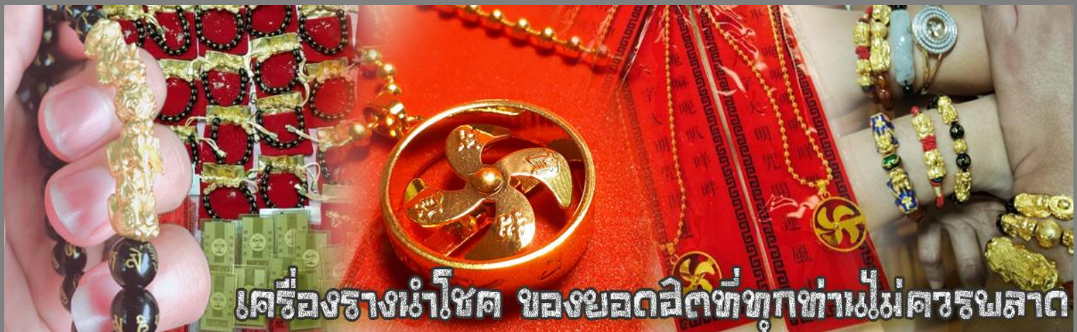
เครื่องรางนำโชค ของยอดฝีมือที่ทุกท่านไม่ควรพลาด

จากนั้นนำท่านสู่ ร้านหยก ชมความงามปีเซียะ ที่เชื่อกันว่าเป็นวัตถุมงคลยอดนิยม ที่มีการนำมาบูชา เพื่อให้ช่วยป้องกันสิ่งชั่วร้าย เรียกทรัพย์สินเงินทองให้ไหลมาเทมา และกักเก็บทรัพย์นั้นไม่ให้รั่วไหลออกไปไหนได้ ชาวจีนโบราณเชื่อกันว่า ปีเซียะเป็นสัตว์ประหลาดที่รวมลักษณะของสัตว์มงคลทั้ง 5 ชนิดไว้ด้วยกัน ได้แก่ มังกร พญาราชสีห์หรือสิงโต, อินทรี, กวาง, และแมว โดยตามตำนานเล่าว่า ปีเซียะเป็นลูกมังกรตัวที่ 9 (เทพแห่งโชคลาภ) ของพญามังกรสวรรค์ มีชื่อเรียกด้วยกันหลายชื่อไม่ว่าจะเป็น “เทียนลก (กวางสวรรค์)” เป็นชื่อเดิม ส่วนจีนกวางตุ้งจะเรียกว่า “เผ่เย้า” และคนจีนแต้จิ๋วจะเรียกว่า “ผีซิว”