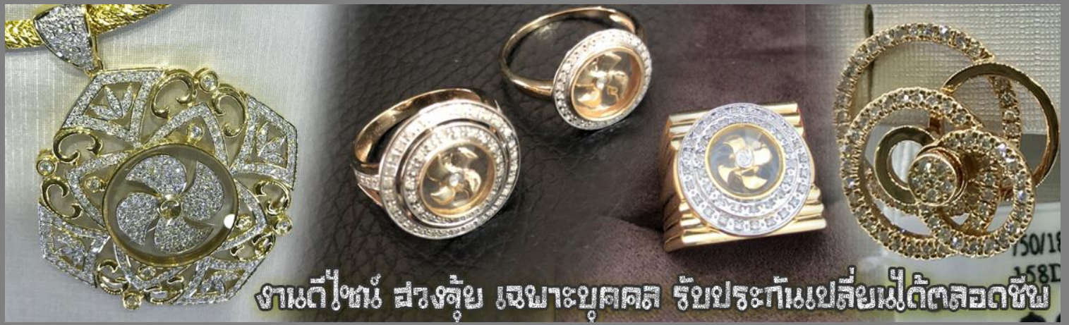
งานดีไซน์ ผงชุบ เชนาะบุคคล รับประกันเปลี่ยนไม่ได้ตลอดชีพ

จากนั้นนำท่านสู่ ร้านหยก ชมความงามปีเซียะ ที่เชื่อกันว่าเป็นวัตถุมงคลยอดนิยม ที่มีการนำมาบูชา เพื่อให้ช่วยป้องกันสิ่งชั่วร้าย เรียกทรัพย์สินเงินทองให้ไหลมาเทมา และกักเก็บทรัพย์นั้นไม่ให้รั่วไหลออกไปไหนได้ ชาวจีนโบราณเชื่อกันว่า ปีเซียะเป็นสัตว์ประหลาดที่รวมลักษณะของสัตว์มงคลทั้ง 5 ชนิดไว้ด้วยกัน ได้แก่ มังกร พญาราชสีห์หรือสิงโต, อินทรี, กวาง, และแมว โดยตามตำนานเล่าว่า ปีเซียะเป็นลูกมังกรตัวที่ 9 (เทพแห่งโชคลาภ) ของพญามังกรสวรรค์ มีชื่อเรียกด้วยกันหลายชื่อไม่ว่าจะเป็น “เทียนลก (กวางสวรรค์)” เป็นชื่อเดิม ส่วนจีนกวางตุ้งจะเรียกว่า “เผ่เย้า” และคนจีนแต้จิ๋วจะเรียกว่า “ผีซิว”