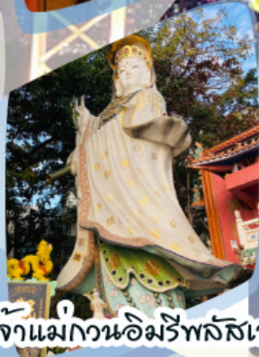
เจ้าแม่กวนอิมรีพลัสเบง