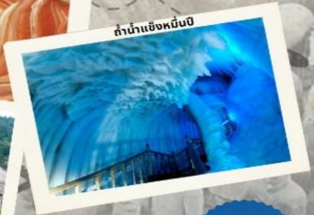
ถ้ำน้ำแข็งหมื่นปี