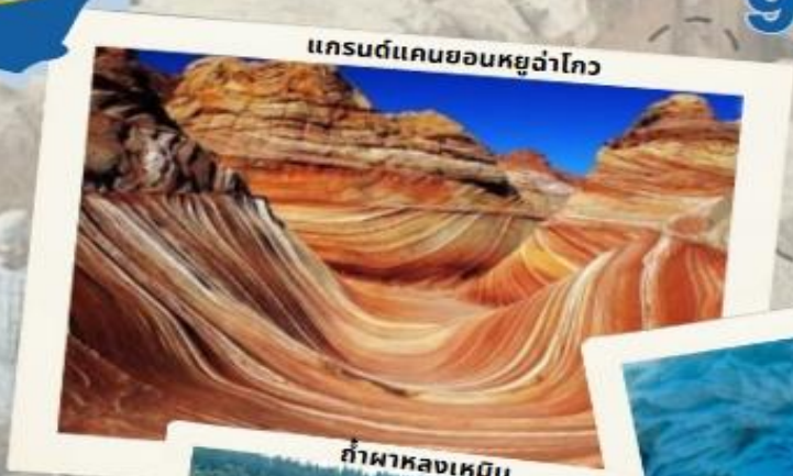
แกรนด์แคนยอนหยูว่าโกว