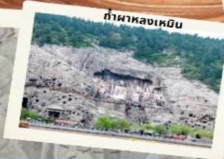
ทัพหลางเหมิน