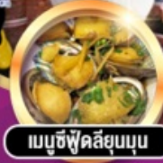
เมนูซีฟู้ดสดชื่นนุ่มนวล