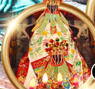
ยืมเงินเจ้าแม่กวนอิมสองห้า