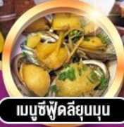
เมนูซีฟู้ดลิ้นจี่นูน