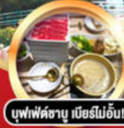
บุฟเฟ่ต์ชาบู เมือรไม้อื่น!!