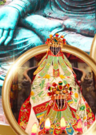
ยืมเงินเจ้าแม่กวนอิมสองฮ่า