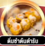
ติ่มซำคั่นตำรับ