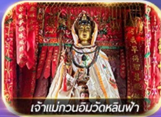
เจ้าแม่กวนอิมวัดหลินฟ้า