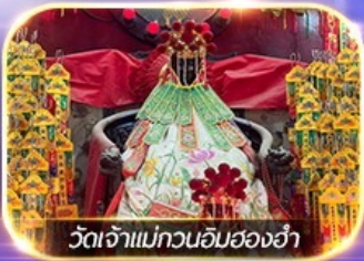
วัดเจ้าแม่กวนอิมฮ่องกง