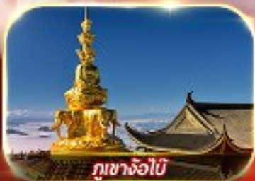
ภูเขาจ้อไบ๊