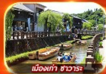
เมืองเก่า ซาวาระ