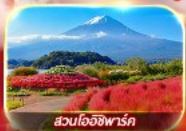
สวนโอยชิพาร์ค