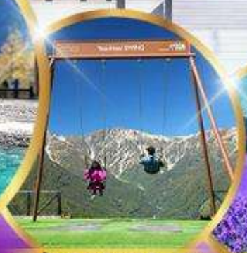
ชิงช้า Yoo hool Swing