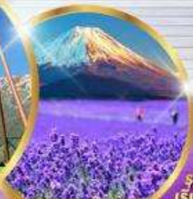
โออิชิ ปาร์ค