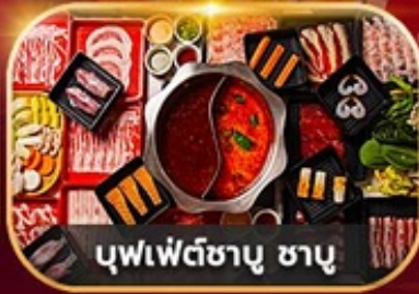
บุฟเฟ่ต์ซาบู ซาบู