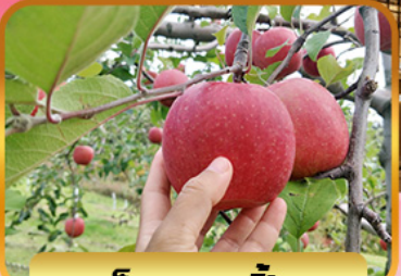
เก็บแอปเปิ้ล