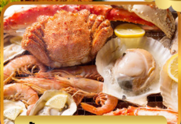
บั้งย่างร้านดังนั้นตะ