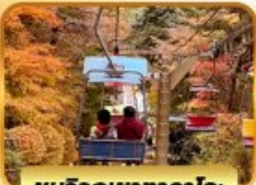
ชมวิวกุเขากาโตะ