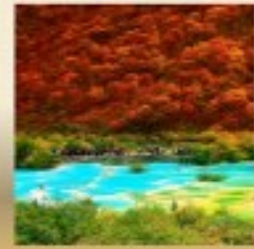
อุทยานแห่งชาติหวงหลง