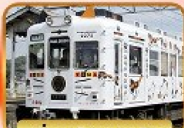
นั่งรถไฟทามะจิง