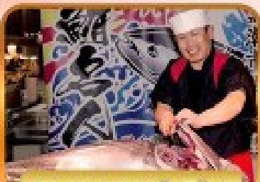
ตลาดปลาคุโรชิโอะ