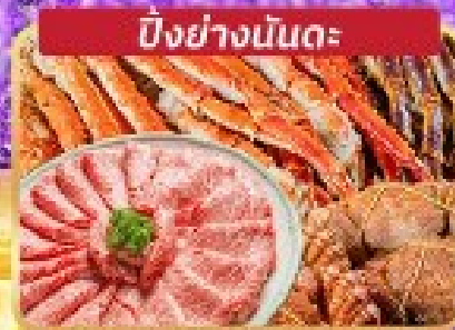
ปิ้งย่างมันตะ