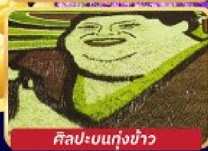
ศิลปะบนทุ่งข้าว