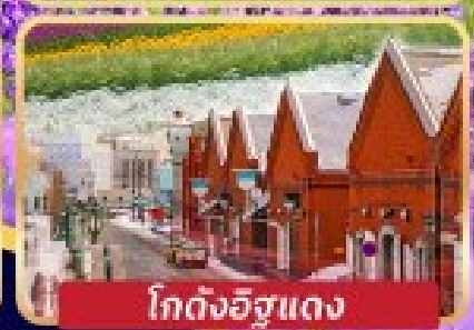
โกดังอิฐแดง