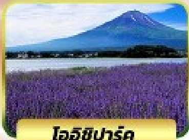
อินอสิปาร์ค