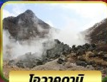
ไอวาคุดานิ