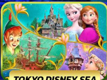
TOKYO DISNEY SEA