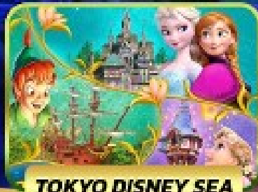
TOKYO DISNEY SEA