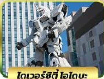
โตเวอร์ซิตี โฮโตบะ

*รวมเข้า ดิสนีย์ซี TOKYO DISNEY SEA 18-23 มิ.ย., 02-07 ก.ค. 24 16-21 ก.ค., 30 ก.ค. - 04 ส.ค. 24