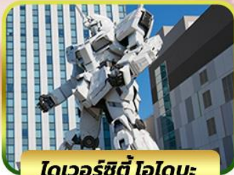
โตเวอร์ซิตี ไอโดบะ