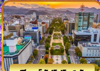
ฟรีเดย์ซิปโปโร 1 วัน