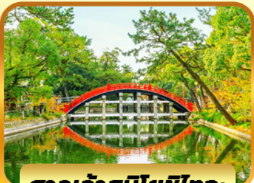
ศาลเจ้าสุมิโยชิไทวะ