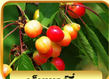
เก็บเชอร์รี่