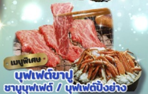
เมนูพิเศษ บุฟเฟ่ต์ชาบู ชาบูบุฟเฟ่ต์ / บุฟเฟ่ต์บิงย่าง