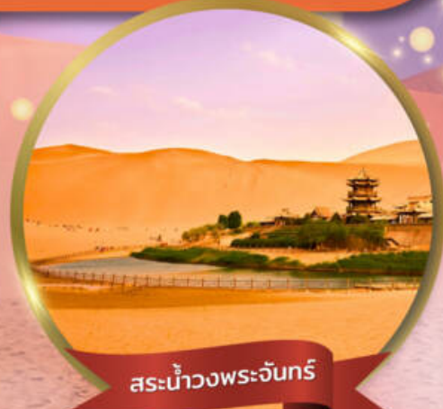
สระน้ำวงพระจันทร์