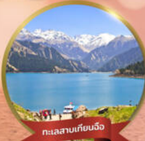
ทะเลสาบเทียนฉือ