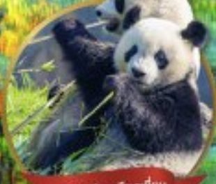
หมี่แพนด้าจิวเจิงตุน