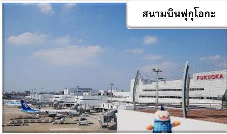
สนามบินฟุกุโอกะ

เวลา 01.45 น. ออกเดินทางสู่ สนามบินฟุกุโอกะ ประเทศญี่ปุ่น โดยสายการบินไทยแอร์เอเชีย เที่ยวบินที่ FD 236