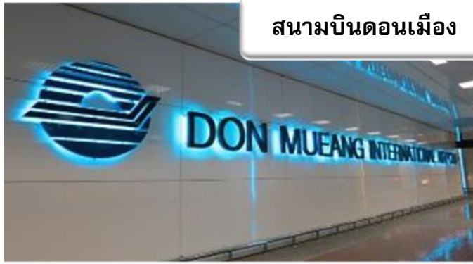
สนามบินดอนเมือง

เวลา 22.30 น. พร้อมกันที่ ท่าอากาศยานดอนเมือง อาคารผู้โดยสารขาออกระหว่างประเทศ เคาน์เตอร์สายการบินไทยแอร์เอเชีย เจ้าหน้าที่คอยให้การต้อนรับดูแลด้านเอกสาร เช็คอิน และสัมภาระในการเดินทาง