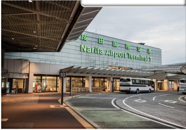
สนามบินนาริตะ

เจ้าหน้าที่รอรับลูกค้าทุกท่านที่สนามบินนาริตะ