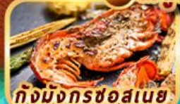
กุ้งมังกรชอสนาย