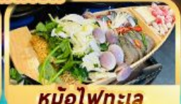
หม้อไฟทะเล