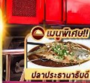
เมนูพิเศษ!! ปลาประธนาธินดี