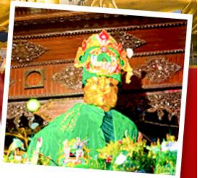
ขอพรแม่ยักยี