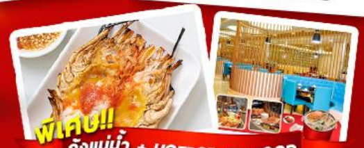
พิเศษ!! ก๊อจแม่น้ำ + HOTPOT SEAFOOD