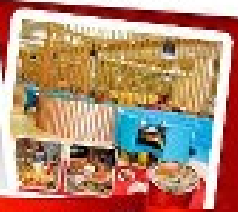
ก๊วยหมี่น้ำ + HOTPOT SEAFOOD