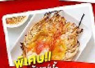
พริกขี้หนู!!