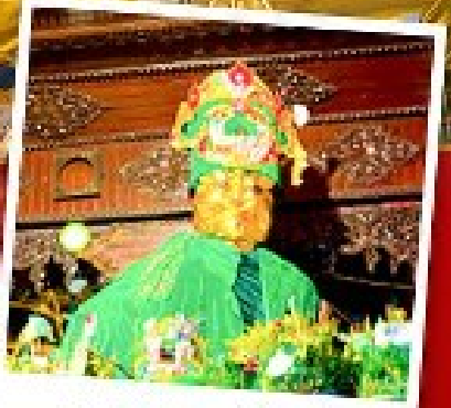
ขอพรแม่ยักยี