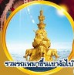
รวมรถเหมาขึ้นเขาจ้อไบ้