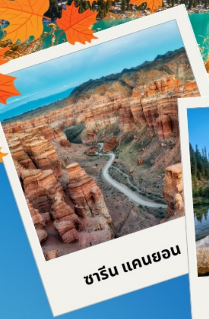
ซาริน แคนยอน