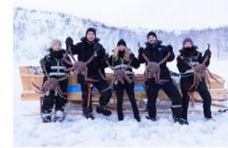
สนุกกับกิจกรรมจับปูยักษ์

00.00 น. ออกเดินทางสู่ เมืองคีร์กเคนส โดยสายการบิน...เที่ยวบินที่... 00.00 น. เดินทางถึงสนามบินเมืองคีร์กเคนส