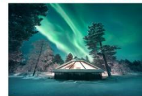
Glass Igloo Hotel

** พักที่ NORTHERN LIGHTS VILLAGE OR SIMILAR **