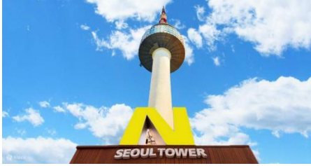
ค่าคืนได้แบบ 360 องศา

โซลทาวเวอร์ หรือ นัมซาน ทาวเวอร์ (N Seoul Tower) คือแลนด์มาร์คชื่อดังและสถานที่ท่องเที่ยวในเกาหลีใต้ที่ห้ามพลาดตั้งอยู่บนภูเขานัมซาน ภายในสวนสาธารณะนัมซานเป็นฐานส่งสัญญาณวิทยุและวิทยุโทรทัศน์แห่งแรกของกรุงโซล ซึ่งยังคงใช้งานอยู่ในปัจจุบัน และยังเป็นสถานที่ท่องเที่ยวในเกาหลีใต้ยอดฮิต สำหรับชมวิวกองโซลที่สวยงามในยาม