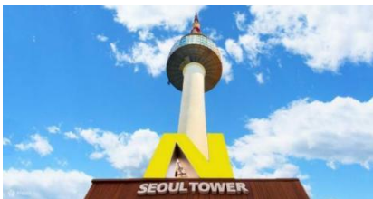
คืนได้แบบ 360 องศา

สวนสนุกล็อตเต้เวิลด์ สวนสนุกในร่มที่มีเครื่องเล่นมากมาย โดยพื้นที่ภายในจะแบ่งเป็น 2 โซนใหญ่ๆ คือ Adventure เป็นสวนสนุกในร่มที่รวมเครื่องเล่นไว้มากมาย ทั้งไวกิ้ง ม้าหมุน บ้านผีสิง ฯลฯ รวมถึงมีลานไอซ์สเก็ตในร่มอีกด้วย ส่วนอีกโซนชื่อว่า Magic Island เป็นโซนกลางแจ้ง อยู่ติดกับทะเลสาบชกซอนโฮซู มีปราสาทสวยๆ ตั้งเด่นเป็นสง่า ตรงนี้แหละจะเป็นจุดถ่ายรูปที่คนเกาหลีฮิตมากๆ ถ้าจะให้ปังสุดๆ ต้องเช่าชุดนักเรียนน่ารักๆ มาใส่ถ่ายรูปด้วยนะ โซนกลางแจ้งมีเครื่องเล่นไฮไลท์เป็น Gyro Drop ดรอปทาวเวอร์ สูง 70 เมตร และเครื่องเล่นมันส์ๆ อีกมากมาย ใครชอบความท้าทายต้องไม่พลาด