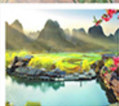
เมืองลิบเล