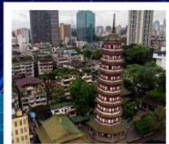
วัดไทรหัดัน

ทัวร์คุณภาพ ไม่ลงร้านช้อปปิ้ง ไม่ขายออฟชั่น