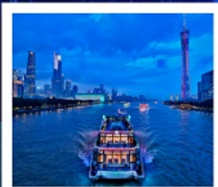
ล่องเรือแม่น้ำจูเจียง

ล่องเรือแม่น้ำจูเจียง / ช้อปปิ้งถนนปักกิ่ง / ช้อปปิ้งถนนซังเซี่ยจิว / วัดไทรหัดัน / ศาลเจ้าตระกูลเฉิน / ถนนคนเดินหย่งซังฟาง