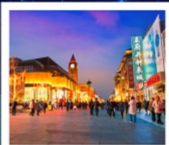
ช้อปปิ้งถนนปักกิ่ง