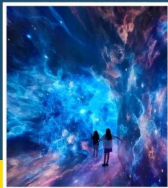
SPACE & TIME CUBE