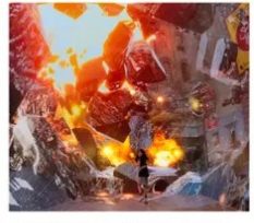
SPACE & TIME CUBE