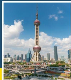
ชั้นชมหอไข่มุก