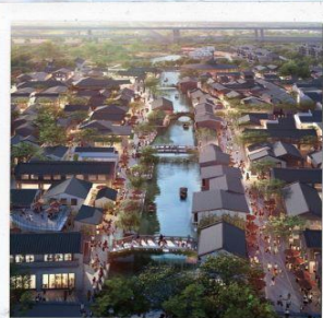
เมืองโบราณ ผานหลงกู่เจิน