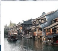
เมืองโบราณผานหลงกู่เจิน