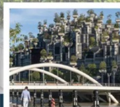
TIAN AN 1,000 TREES