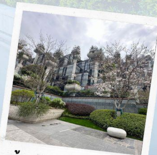
ห้าง Tian AN 1,000