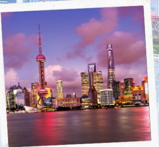
ชมวิวยามค่ำคืน