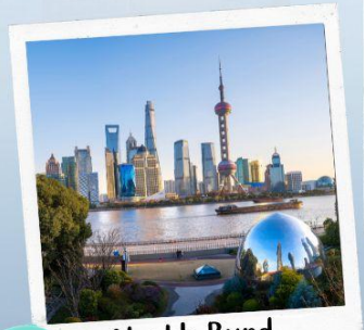
North Bund Greenland