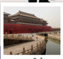
พระราชวังกู้กง