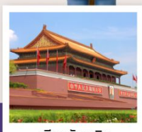
เทียนอันเหมิน

กำแพงเมืองจีนด่านจวิหยงกวน / สนามกีฬาปักกิ่ง / ช้อปปิ้งย่านซานหลี่ตุ่น / วัดลามะ จัตุรัสเทียนอันเหมิน / พระราชวังโบราณกู้กง / หอประชุมเทียนถาน / พระราชวังฤดูร้อนอวิ๋เหอหยวน