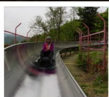
สไลเดอร์ลงจากกำแพงเมืองจีน