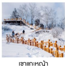
เขาแคะหญ้า

ฟรี!! ...ถุงมือ ผ้าพันคอ หมวก ท่านละ 1 ชุด