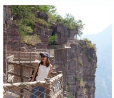
เขากิ๊ยนเจี๋ยซาน