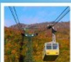
ภูเขาไฟอุสุ