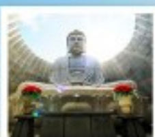
เบ็นเนะพุทธรูปเจ้า