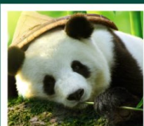
ศูนย์หมีแพนด้า