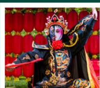
โชว์เปลี่ยนหน้ากาก