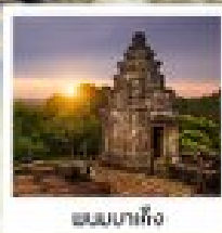
เขมบาคี้ง

ทิวสิ่งศักดิ์สิทธิ์...ทอดยาว 400 เมตร ที่...น้ำตกพนมกุเลน