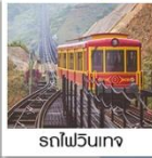
รถไฟวินเทจ