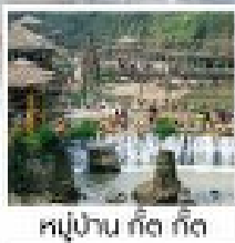
หมู่บ้าน ถัด ถัด