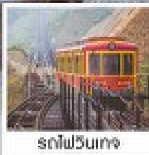
รถไฟวินเทจ