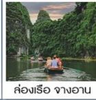
ล่องเรือ จางอาน