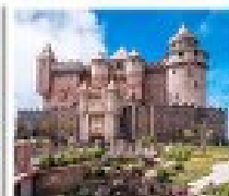
บาร์ฮอิลล์

แพ็คเกจส่วนตัว 7 - 9 ท่าน **ราคานี้ไม่รวมตั๋วเครื่องบิน**