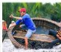
นั่งเรือกระด้ง